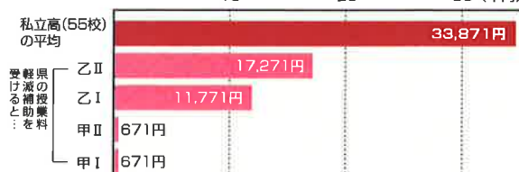
◇ 図2 授業料の生徒1人当たりの 平均月額(父母負担の額)

(注)「県の授業料軽減補助を受けると…」の甲I、甲II、乙I、乙IIの区分は、図1を参照。